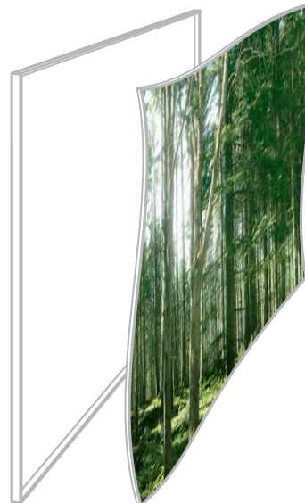
Beispiel: 180 cm x 150 cm x 4,2 cm